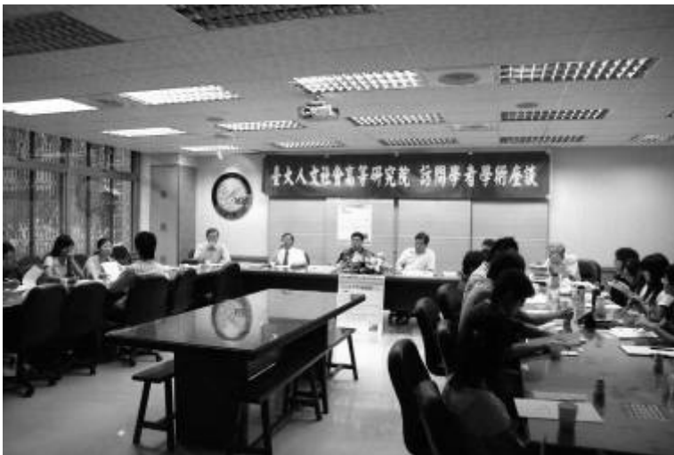
▲馬教授於農業經濟學系會議室與農經及經濟領域之學者座談，提供詳實的歷史脈絡分析觀點。