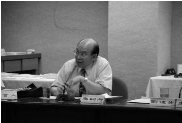
▲李校長親自出席參加給予高度肯定，並期望跨領域討論會議能持續舉辦。