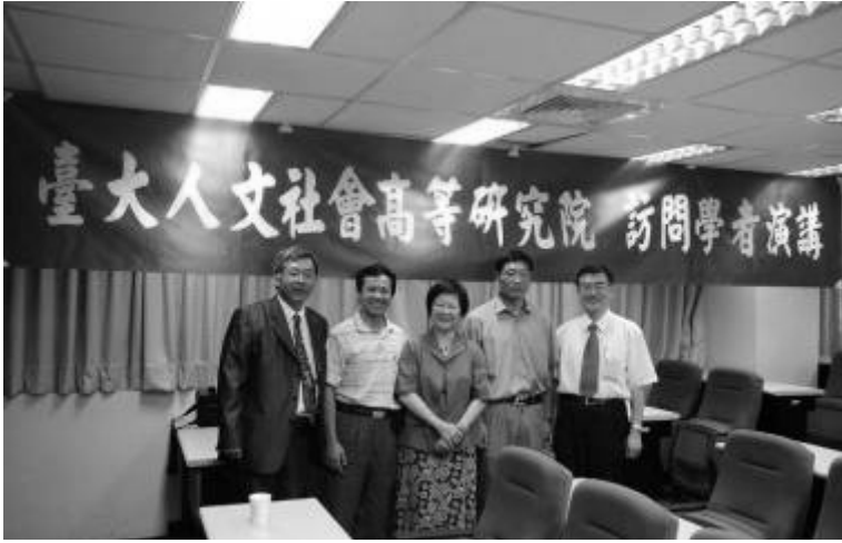
▲馬教授於本校地理環境資源學系三樓視聽教室闡述「從沃土到瘠壤：淮北地區社會生態的歷史變遷」。