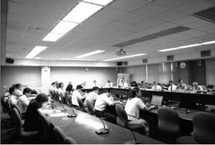
▲會中出席老師針對議題熱烈討論並踴躍提出建議。