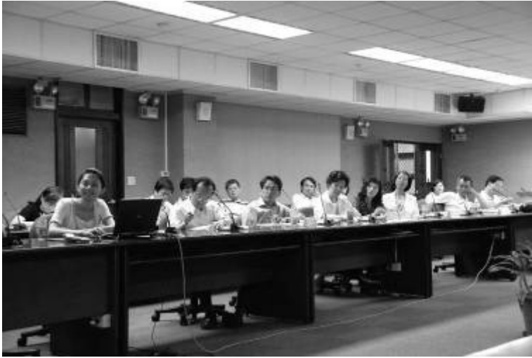
▲第二次人文領域腦力激盪會議邀請校內通識教育課程教師及共同教育委員一同參與。