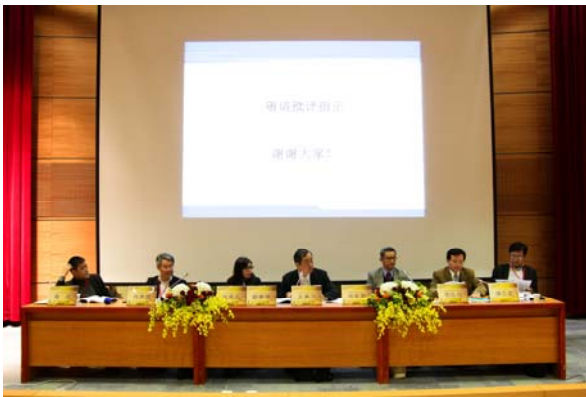
第四場「抗爭政治與民主前景」