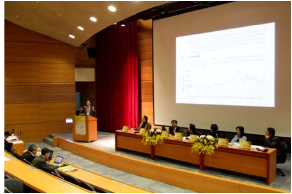
第一場「全球化與中國大陸的經濟轉型」