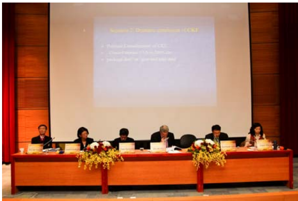
第二場 "Rising Regionalism: China and East Asia"