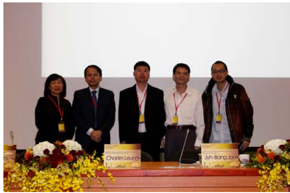
第五場 "Globalization and Real Estate Market"