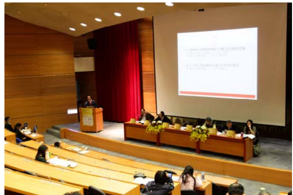
第三場「全球化與中國大陸的社會變遷」