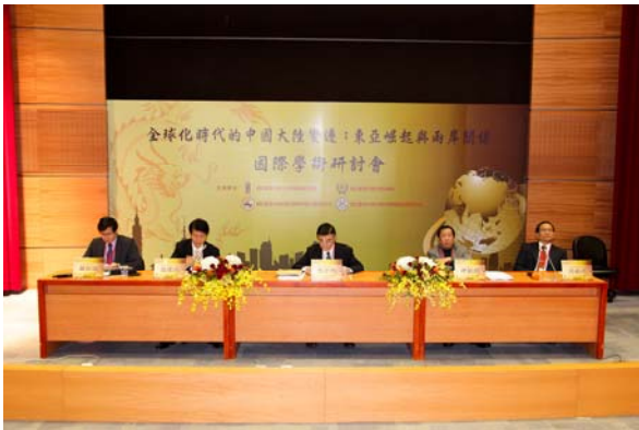
第六場圓桌論壇「十八大後之兩岸關係發展」